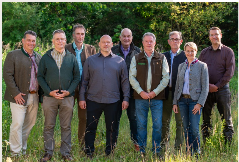
Das neu gewählte Präsidium. Wer wofür zuständig ist, das erfahren Sie auf den nächsten beiden Seiten.