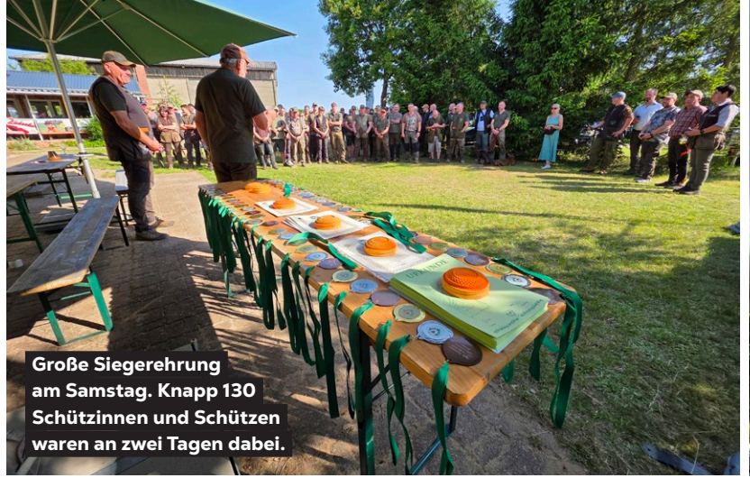
Große Siegerehrung am Samstag. Knapp 130 Schützinnen und Schützen waren an zwei Tagen dabei.